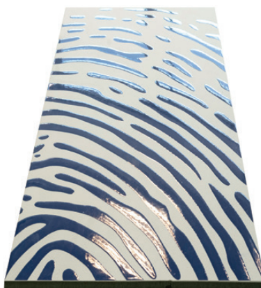
Płytki nadrukowane szklivem